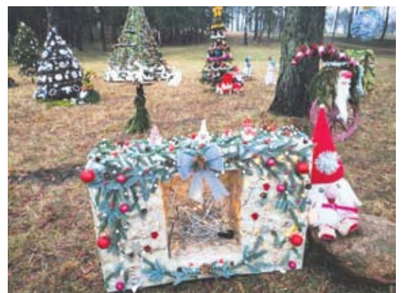
Levaniškių bendruomenės iniciatyva miestelyje atsirado eglučių parkas.