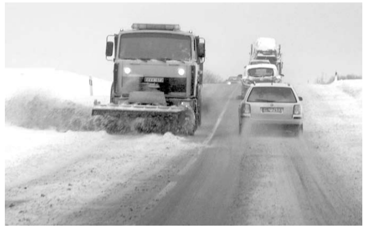
Priekaištus dėl prastai valomų kelių gyventojai gali išsakyti trumpuoju numeriu 1871.

- Koks dėmesys slidumo susidarymo prevencijai skiriamas aukščiausio lygio prie-