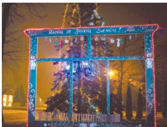
Dėl tinkamiausios vietos asmenukų langui svėdasiečiai kreipėsi net į vietos fotografą.